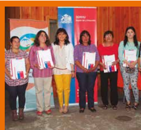
SERVIU, inversión histórica en Vilcún