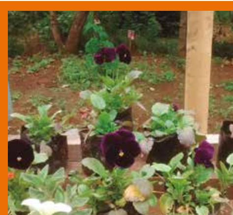
Apoyando el desarrollo económico local