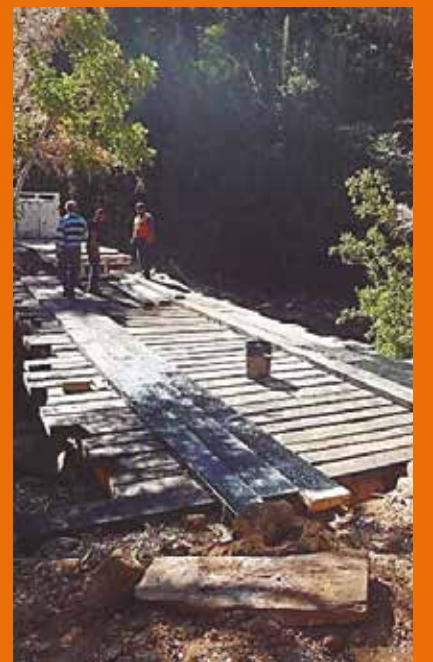
Conectividad, prioridad municipal