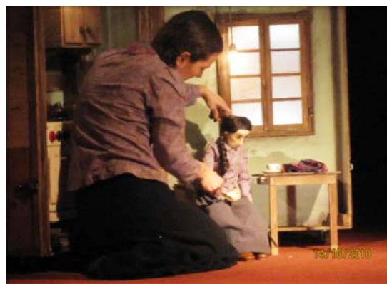
Teatro Sur, Centro Cultural Vilcún – 50 personas