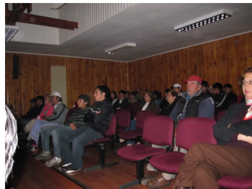
Trio de Jazz Organik Centro Cultural Vilcún - 80 Personas

Presentación Grupo Kunza: “Grupo Musical Kunza, expresión de música andina, actividad que fue realizada al aire libre en la Plaza Municipal de la comuna de Vilcún durante el mes de marzo, participando de ella 120 personas.