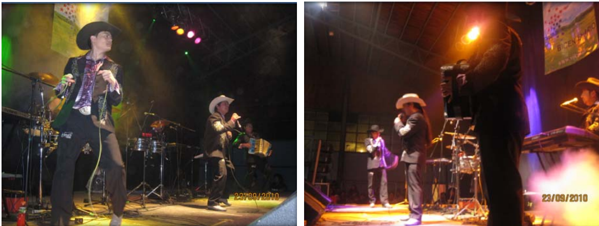
Los Kuatros del Sur, Gimnasio Municipal de Vilcún 1400 asistentes.

Los Kuatros del Sur y Súper Cumbieros, artistas de La Cultura popular divertieron e hicieron celebrar a toda la comuna de Vilcún y sus alrededores.