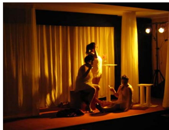
Compañía de Teatro Circulo, Centro Cultural Vilcún – 80 Personas