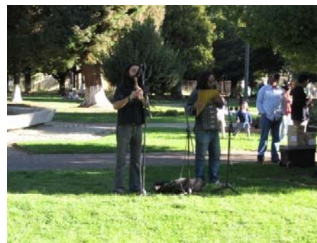
(Grupo de música Andina “Kunza”, Plaza Comuna de Vilcún - 120 Personas)