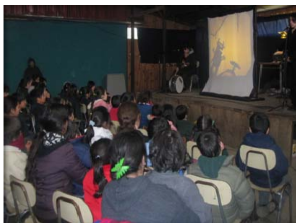
Agrupación Triciclo Pajarito Esc. Municipales Collín Alto y San Patricio – 300 Niños

Presentación Ballet Millauquén: La celebración Bicentenario de nuestro país en la comuna de Vilcún fue iniciada con la presentación en un Show masivo del Ballet Nacional Millauquén del Instituto Cultural Banco Estado de Santiago quienes presentaron diferentes montajes coreográficos “Saludo al Pueblo Mapuche” “Bailes de la Patagonia” “Ginganas” alusivas al Bicentenario y “Fiesta de la Tirana”, quienes cuentan con una destacada trayectoria y repertorio, logrando obras que han reflejado la diversidad cultural tradicional, disfrutadas a lo largo de Chiloe y países de Europa.