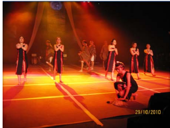
Ballet nacional Millauquén, Gimnasio Municipal de Vilcún – 900 Personas)

Concierto folclórico Hualtata: Actividad conmemorativa de nuestro aniversario comunal 2010, que contó con la participación de 70 personas en el Centro Cultural Municipal de la comuna de Vilcún. Esta agrupación de Tomé – Octava Región conquistaron al público asistente con su puesta en escena de “Bailes de Tierra en Chile – de la destacada investigadora señora Margot Loyola.