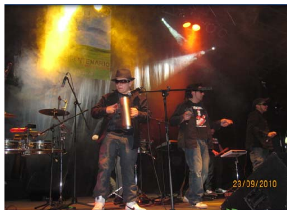
Super Cumbieros, Gimnasio Municipal Vilcún