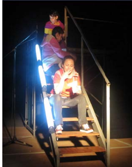
Teatro Círculo, Gimnasio Municipal Vilcún, 100 Personas

Teatro Círculo Obra Niñas Arañas: Actividad teatral enmarcada en la conmemoración de nuestro aniversario comunal, desarrollada en conjunto con la Agrupación Precordilleranos de Vilcún. La Obra fue expuesta en el gimnasio municipal de Vilcún.