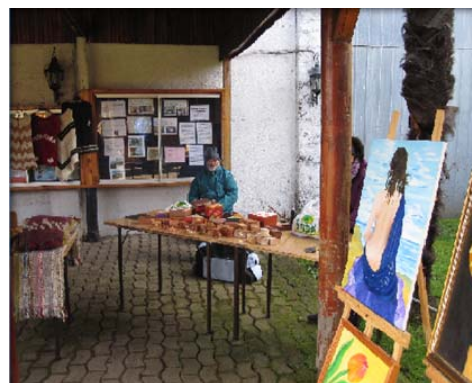
Agrupación de Pintura “Aguada”, Centro Cultural Municipal