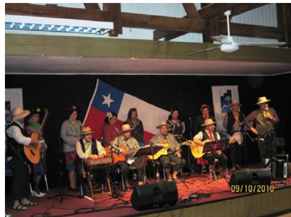
(Conjunto Folclórico Hualtata, Centro Cultura Vilcún, 80 Personas)