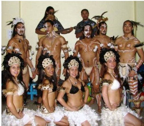
Ballet Ma'ara Nui, Gimnasio Municipal Cherquenco – 800 Personas

Presentación Ballet Ma'ara Nui: Compañía artística formada por jóvenes músicos, bailarines y artesanos de la lejana Isla de Pascua, Ma'ara Nui representantes de Chile en el circuito de festivales CIOFF en Polonia, España, Francia e Inglaterra 2010. Llegaron a deleitar a los vecinos de la localidad de Cherquenco en una gran presentación la cual duró aproximadamente una hora veinte minutos en donde interactuaron con el público entregando cultura y alegría a todos los asistentes.