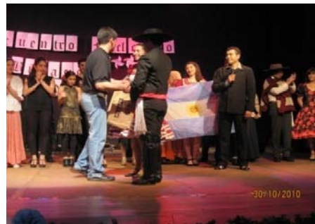
Ballet Argentino Santiago Ayala, Gimnasio Municipal Vilcún – 600 Personas

Tardes Culturales de Música y Pintura: Actividad desarrollada al aire libre, con intervención de diferentes espacios físicos municipales: Área verde Villa Los Molinos de la localidad de Cajón, Plaza de Armas Municipal de la comuna de Vilcún, Plaza Municipal de la localidad de Cherquenco.