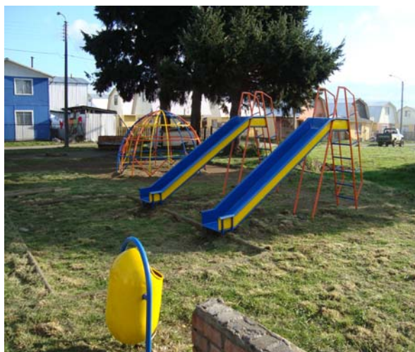
Zona de Juegos Villa Los Rios,

Durante el año 2010, se realizaron restauraciones a todas las zonas de juegos infantiles de la comuna, inversión que significo un aumento en el uso de este equipamiento por parte de los niños.