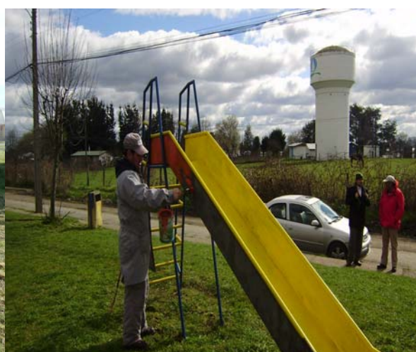
Villa Lagos del Sur